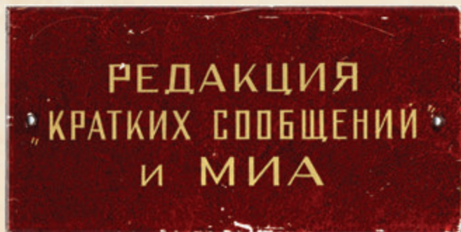
Табличка на двери редакции, 1950-е годы.